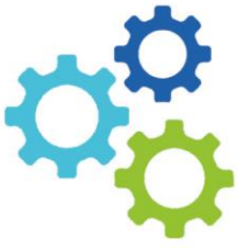
Abb. 3). Unternehmensaufsicht und Führung müssen immer wieder selbstkritisch prüfen, auf welcher der drei Ebenen diskutiert, entschieden und umgesetzt wird. Genau das ist gemeint mit der an sich simpel klingenden Frage „Führen wir die richtigen Diskussionen?“