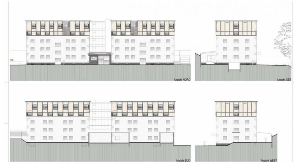
Geplante Fertigstellung: Sommer 2022.