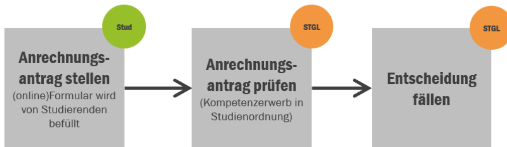
Abbildung 1: Prozessschritte des Validierungsverfahrens

Nach §12 (4) FHG ist das Verfahren der Validierung der Lernergebnisse in die nachfolgenden Prozessschritte untergliedert (siehe Abbildung 1). Die Definition der Kompetenzen ist in den einzelnen Lehrveranstaltungen der jeweiligen Studienordnungen gegeben.